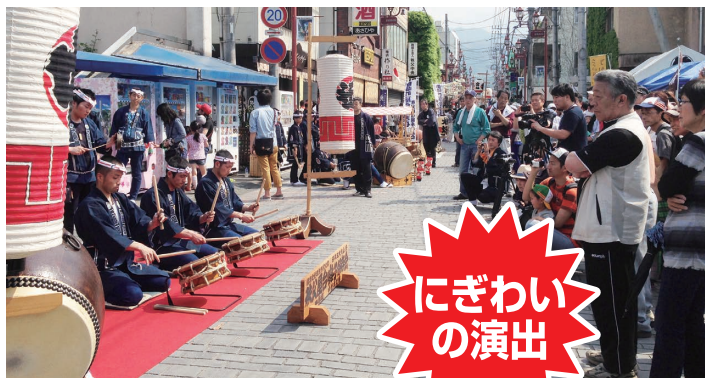
秩父屋台囃子20連太鼓