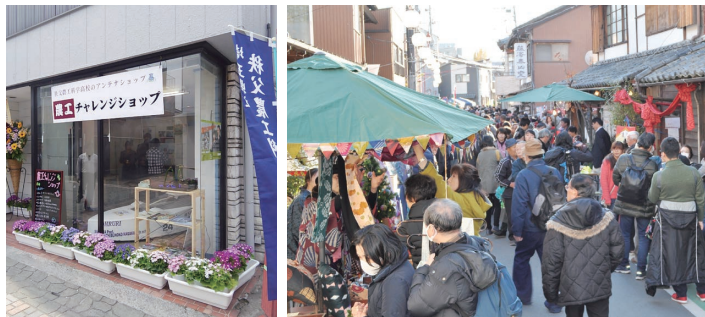
農工チャレンジショップ